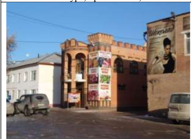
Пр-т Ильича, 27 А, ИП Мамедов Р.А