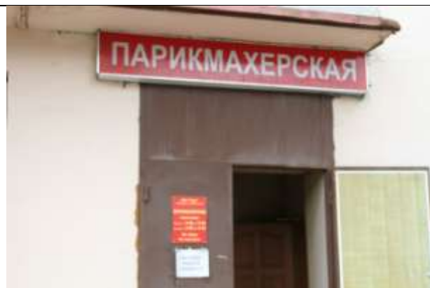
г. Шатура, пр-т Ильича, 34 ООО "Лада"