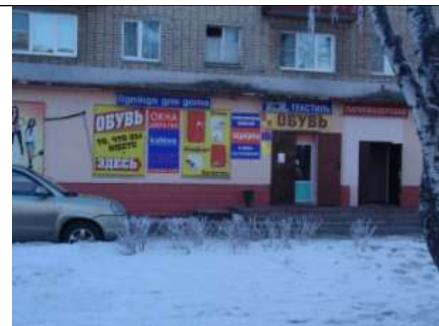
г. Шатура, пр-т Ильича, 34