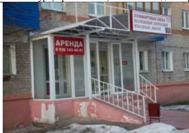
г. Шатура, пр-т Ильича, 37/2, пом. 49