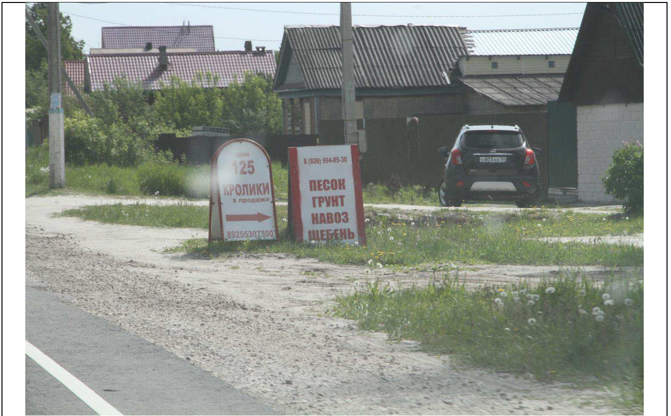
с. Петровское, напротив д. 125