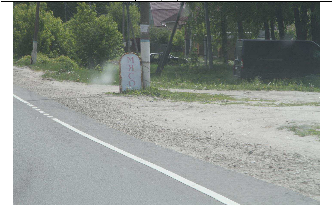
с. Петровское, напротив д. 61